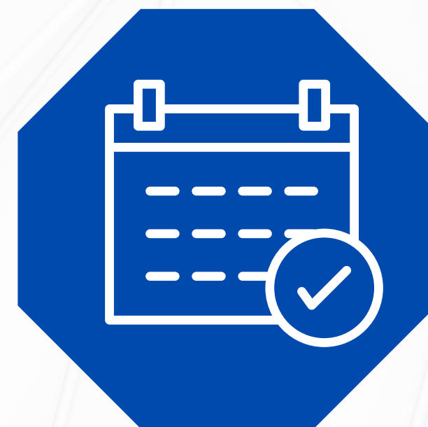
CALENDARIO DE ACTIVIDADES