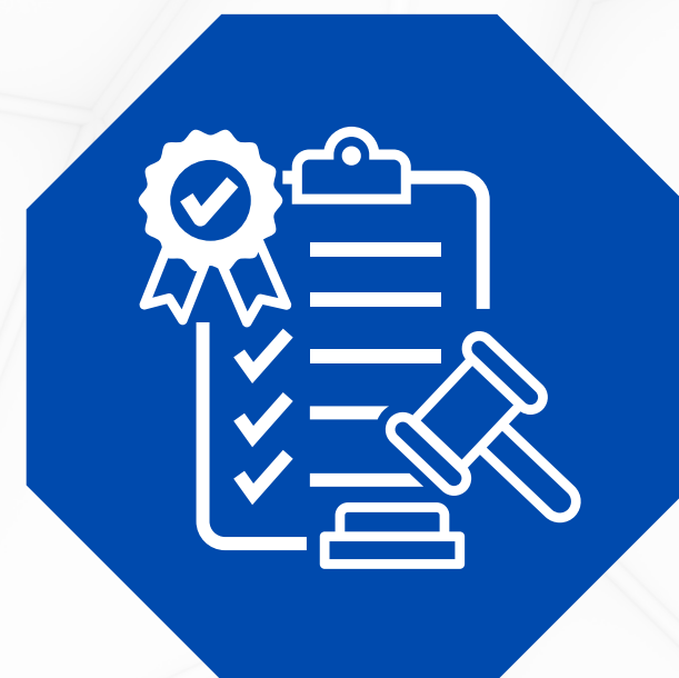
NORMAS DE PROCEDIMIENTO