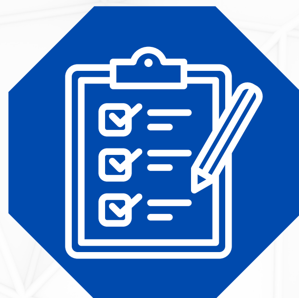
TEMARIO Y MATERIAL DE REFERENCIA