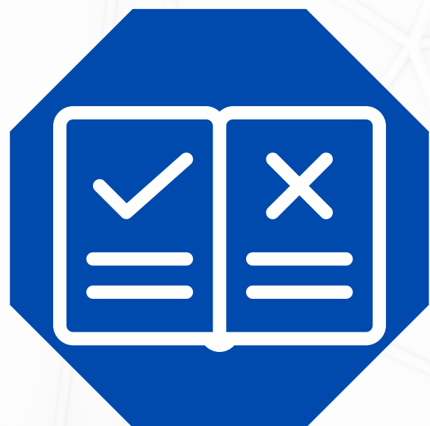
CÓDIGO DE CONDUCTA