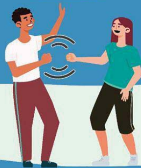
CON EL PUÑO DE LEJOS