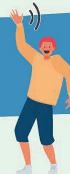
AGITANDO LAS MANOS