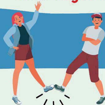
CON EL PIE

Hay otras formas de saludar no lo hagas de mano, beso o abrazo