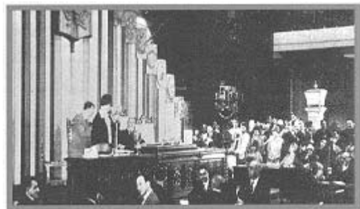
Doris Stevens, derecha, en la Sexta Conferencia Internacional Americana, en la Habana, durante su histórico discurso pidiendo el reconocimiento de los derechos de la mujer en las Américas (1928)

Las últimas décadas del siglo XIX vieron florecer el interés público y el apoyo gubernamental por la educación de la mujer en las Américas. Si bien la naturaleza y el propósito de esa educación fue tema de mucho debate, en varios países gran número de mujeres logró completar la enseñanza primaria y secundaria.