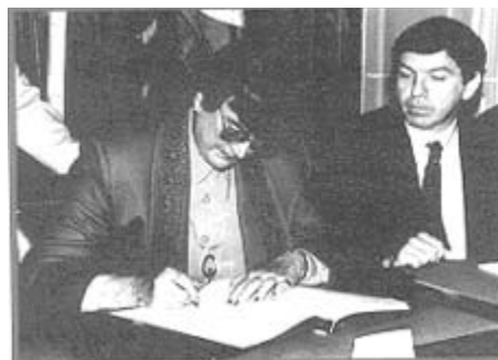
Josefina Bilbao, de Chile, Ministra/Directora del Servicio Nacional para la Mujer (SERNAM), firma la Convención Interamericana para Prevenir, Sancionar y Erradicar la Violencia contra la Mujer en presencia del Secretario General de la OEA, César Gaviria, el 17 de octubre de 1994

En el año 1993 la Reunión Intergubernamental de Expertas para Considerar el Proyecto de la Convención Interamericana sobre la Mujer y la Violencia celebró dos sesiones (en abril y octubre) y logró sus objetivos con tanta minuciosidad y celeridad que la CIM pudo convocar a una Asamblea Extraordinaria de Delegadas en abril de 1994 para estudiar y adoptar la Convención para presentarla a la Asamblea General. Después de ser adoptada por el vigésimo cuarto período ordinario de sesiones de la Asamblea General de la OEA, que tuvo lugar en Belém do Pará, Brasil, en junio de 1994, varios gobiernos de los Estados miembros firmaron inmediatamente. La Convención Interamericana para Prevenir, Sancionar y Erradicar la Violencia contra la Mujer, Convención de Belém do Pará no sólo reconoce que la violencia contra la mujer constituye una violación de los derechos humanos, sino que la define en la esfera pública y privada. Hasta la fecha, treinta y dos Estados miembros de la OEA han adoptado y/o ratificado esta convención interamericana. Una vez más, la CIM es el primer organismo internacional en impulsar a los cuerpos políticos internacionales a que brinden atención especial a un tema que no sólo es de gran importancia para la mujer sino también para el bienestar de una sociedad democrática.