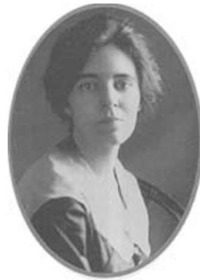
Alice Paul, líder del Partido Nacional de la Mujer (Estados Unidos)