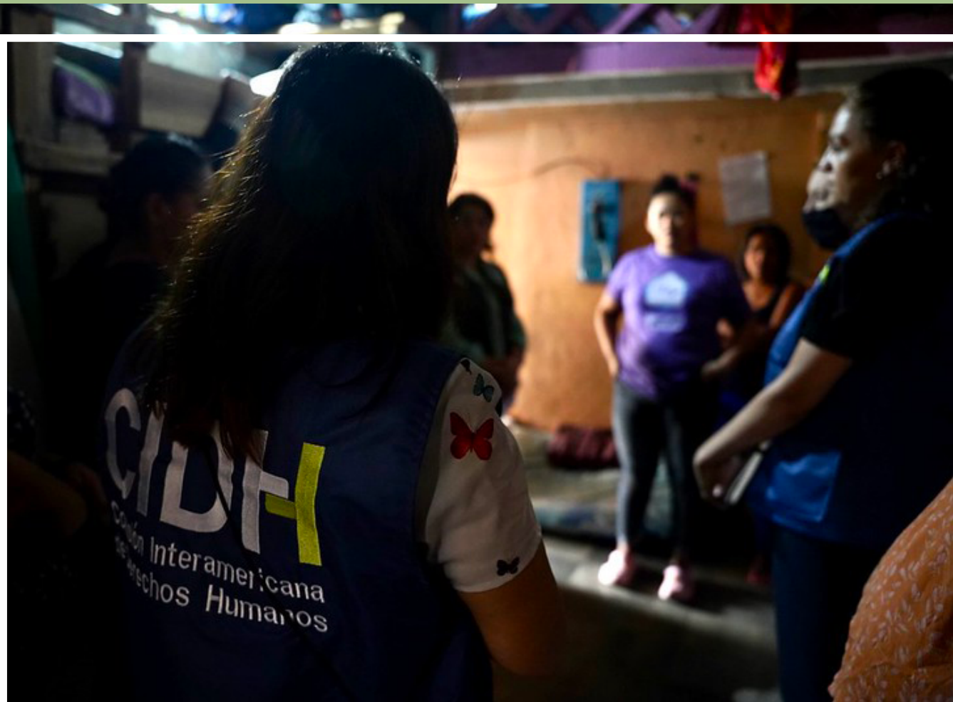
Visita in Loco Honduras 26 de abril, 2023