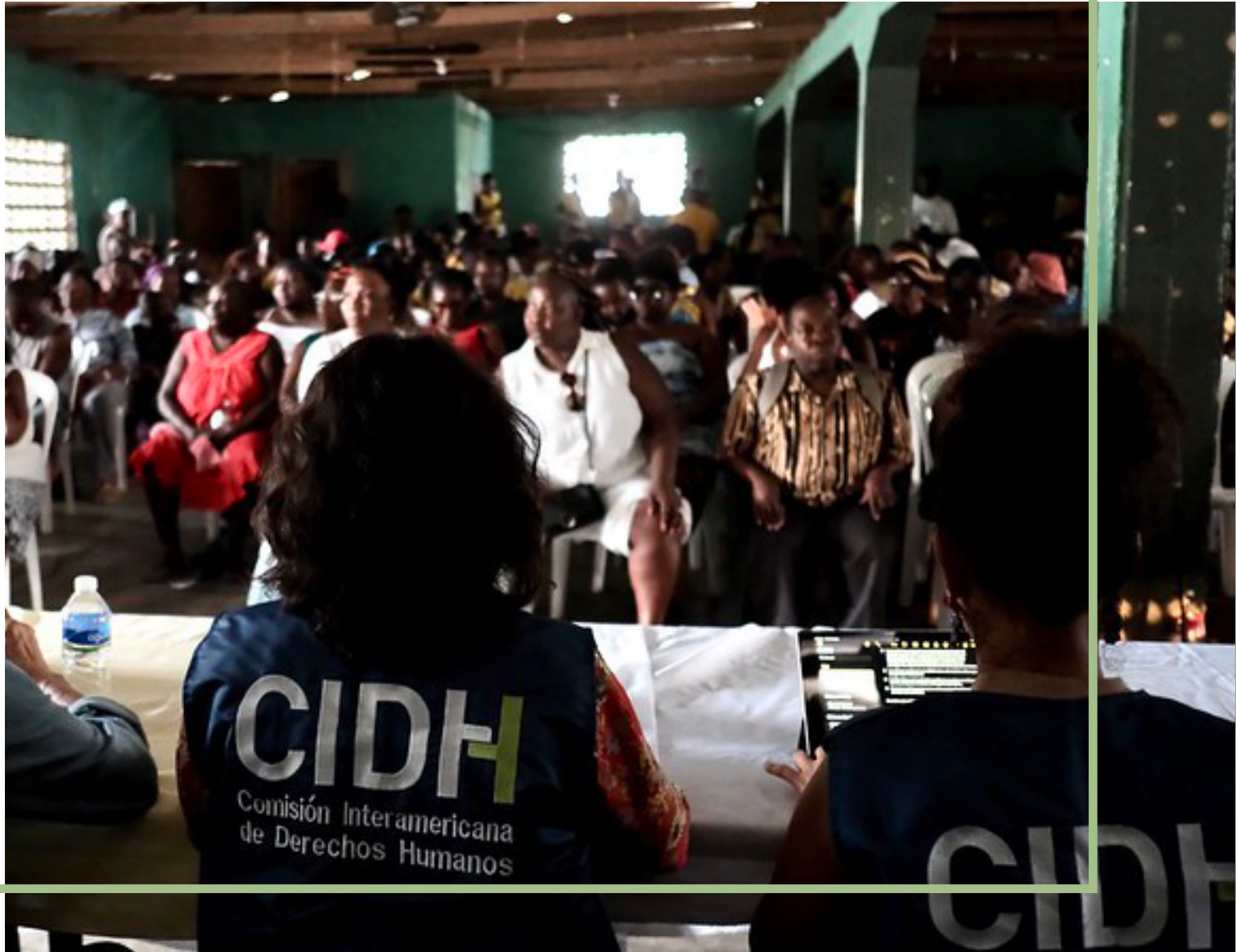
Visita in Loco Honduras 25 de abril, 2023