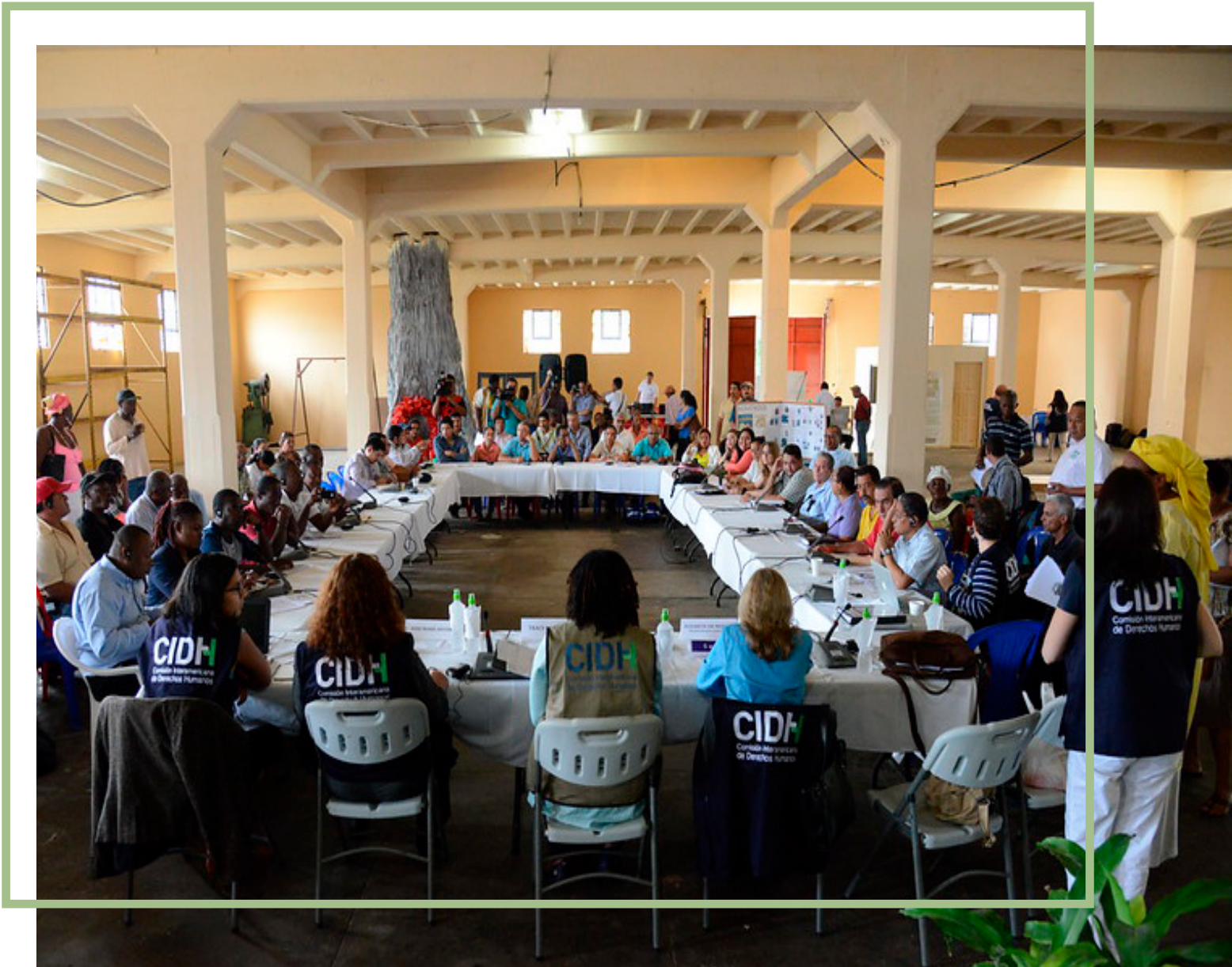
CIDH se reúne con organizaciones de la sociedad civil en La Ceiba, Honduras. 2 de diciembre, 2014.