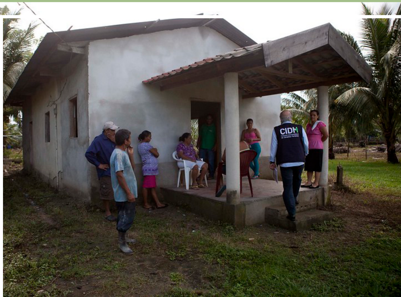
CIDH visita Comunidad Panamá, Honduras. 2 de diciembre, 2014.