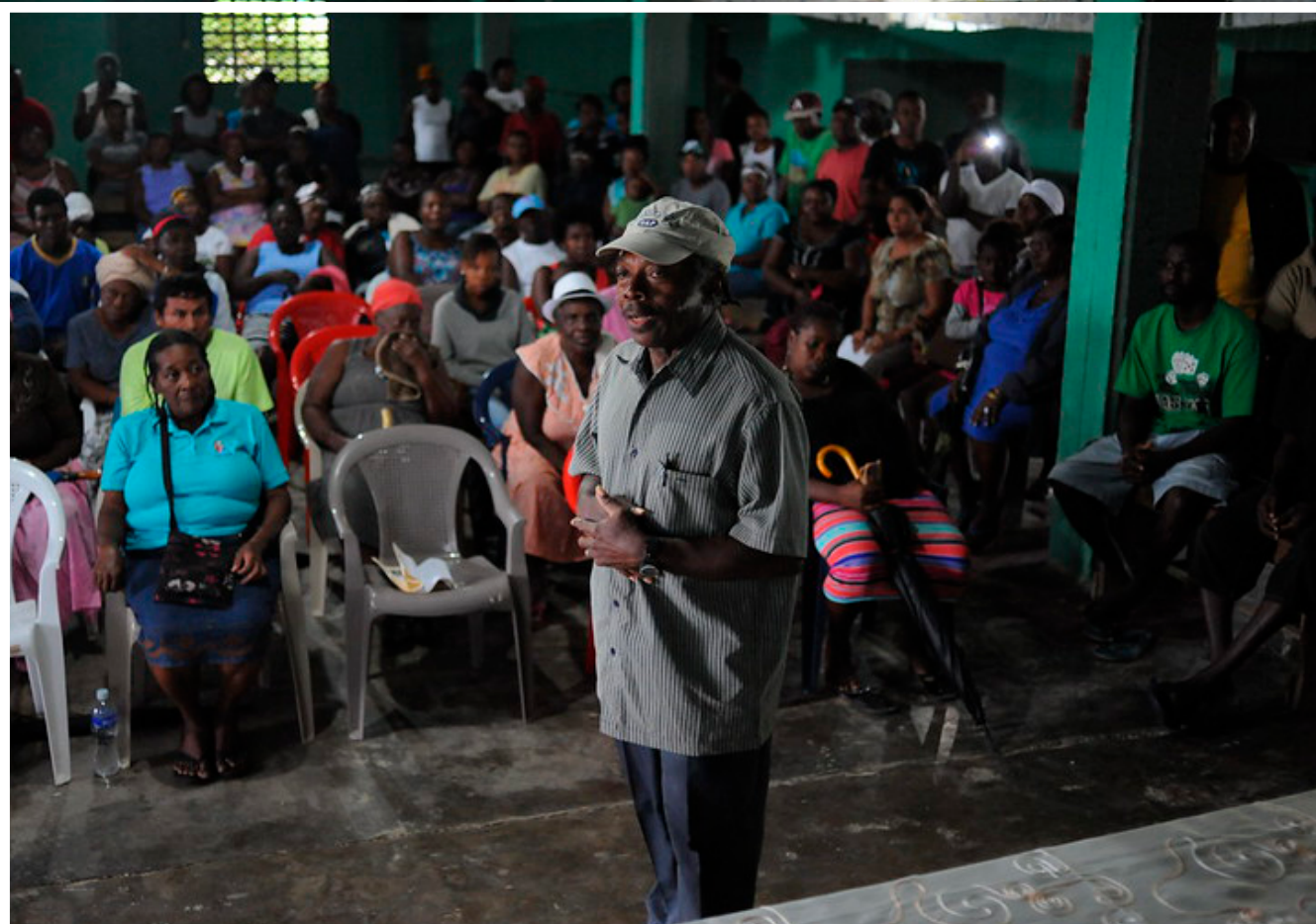
Delegación de la CIDH visita Comunidad San Juan, Honduras. 2 de diciembre, 2014.