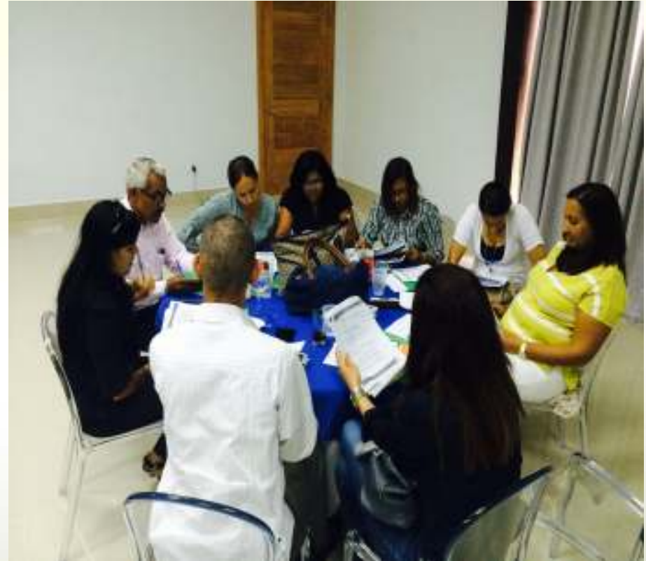
Análisis de casos puntuales de aplicación de las leyes laborales

Se realizan periódicamente unificaciones con miembros del Cuerpo de Inspección de diferentes jurisdicciones, con el propósito de mantenerlos actualizados sobre cualquier novedad que surja en Materia Laboral y Seguridad Social y verificar que todos cumplan con el criterio institucional.