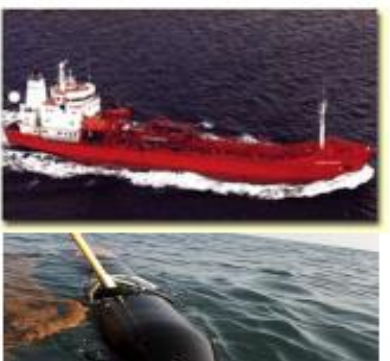
Modalidad de trafico utilizada a principio del año 2016