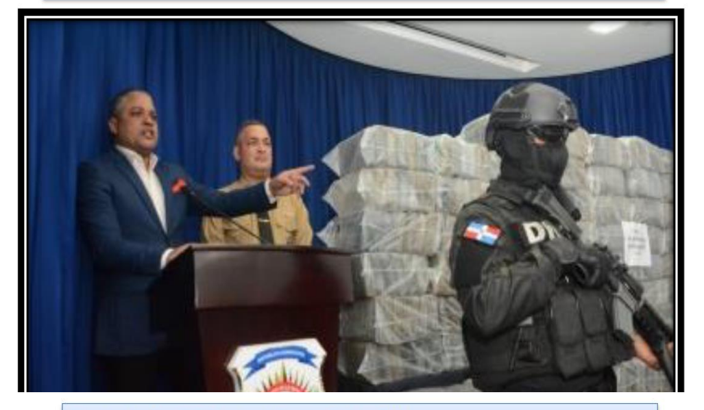
Caso de los 120 paquetes en Boca Chica. 25/06/2019

Autoridades decomisan 689 paquetes presumiblemente cocaína en La Altagracia. 08/02/2019