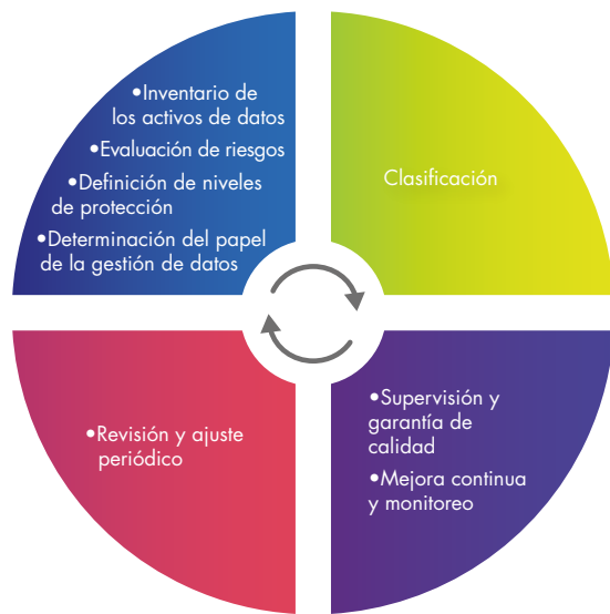
Figura 2- Recomendaciones para establecer un sistema de clasificación de datos

apliquen medidas de seguridad adecuadas a la tecnología actual y al entorno de amenaza/riesgo, pero también al valor y la sensibilidad cambiantes de los datos clasificados. La información clasificada debe revisarse regularmente para evitar que la información heredada se mantenga vigente, lo cual es costoso de almacenar y administrar. También es aconsejable revisar periódicamente las políticas y procedimientos de clasificación.