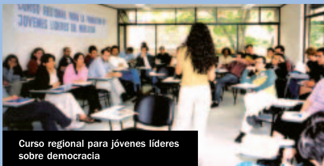
Curso regional para jóvenes líderes sobre democracia