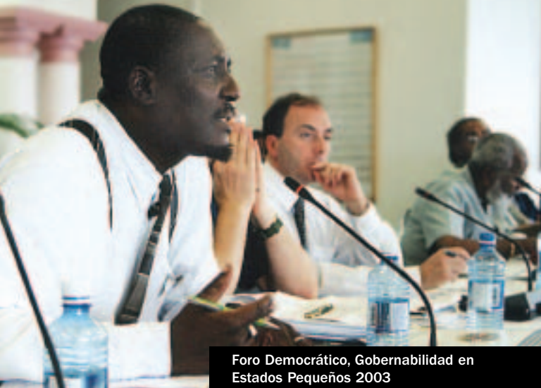
Foro Democrático, Gobernabilidad en Estados Pequeños 2003