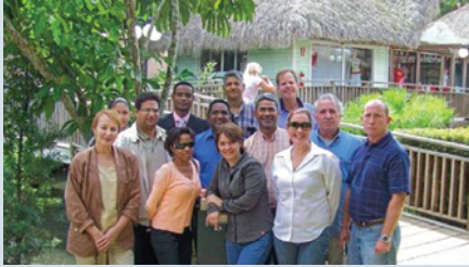
Expertos marítimos de la República Dominicana reunidos en Abril de 2009, para discutir las técnicas de valorización marina y calcular los beneficios de los servicios del ecosistema tales como la pesca, el turismo y la protección de las costas.

Declarado parque nacional en 1975, el Parque Nacional del Este se encuentra en el límite Suroriental de República Dominicana. El parque incluye toda la península al sur de estas provincias y mide 80,800 hectáreas, lo cual es distribuido casi equivalentemente entre hábitats terrestres y costeros. La línea costera del parque ofrece una variedad de formaciones de corales y es una excelente zona para practicar el buceo, especialmente por la zona occidental del parque.