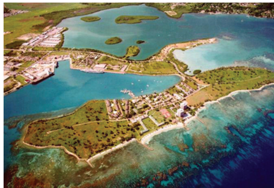
Desde la sierra hasta el arrecife, los datos de IABIN están siendo utilizados para mejorar la toma de decisiones con miras al desarrollo sostenible.

E n la Declaración de la Quinta Cumbre de las Américas llevada a cabo en Puerto España, Trinidad y Tobago el 19 de Abril de 2009 “Asegurando el futuro de nuestros ciudadanos mediante la promoción de la prosperidad humana, la seguridad energética y la sostenibilidad ambiental”, los Presidentes de las Américas reiteraron en el párrafo 64: