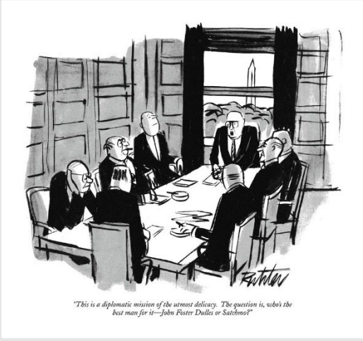
Caption: "This is a diplomatic mission of the utmost delicacy. The question is, who's the best man for it - (U.S. Secretary of State) John Foster Dulles or Satchmo (Louis Armstrong)?" (The New Yorker; April 19th, 1958)

Louis Armstrong wears a catcher's mask to protect himself from enthusiastic fans. Buenos Aires, Argentina, 1957.