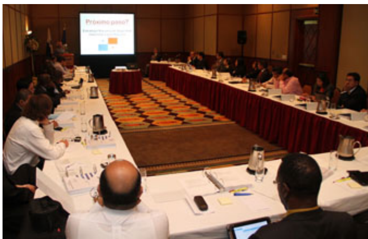
Grupo de Participantes