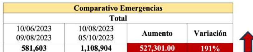
Cuadro Nro. 2 Comparación de número de llamadas de emergencia, a nivel nacional Periodo 10 JUN – 09 AGO vs 10 AGO – 05 OCT