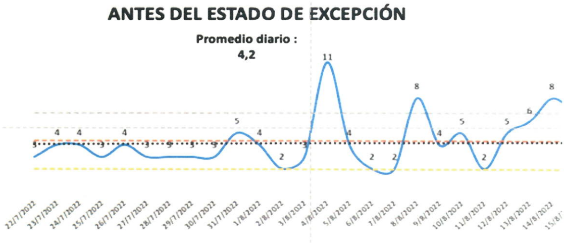
Imagen N° 2: Contención de los indicadores de violencia, comparados con los 24 días anteriores a la emisión del estado de excepción.