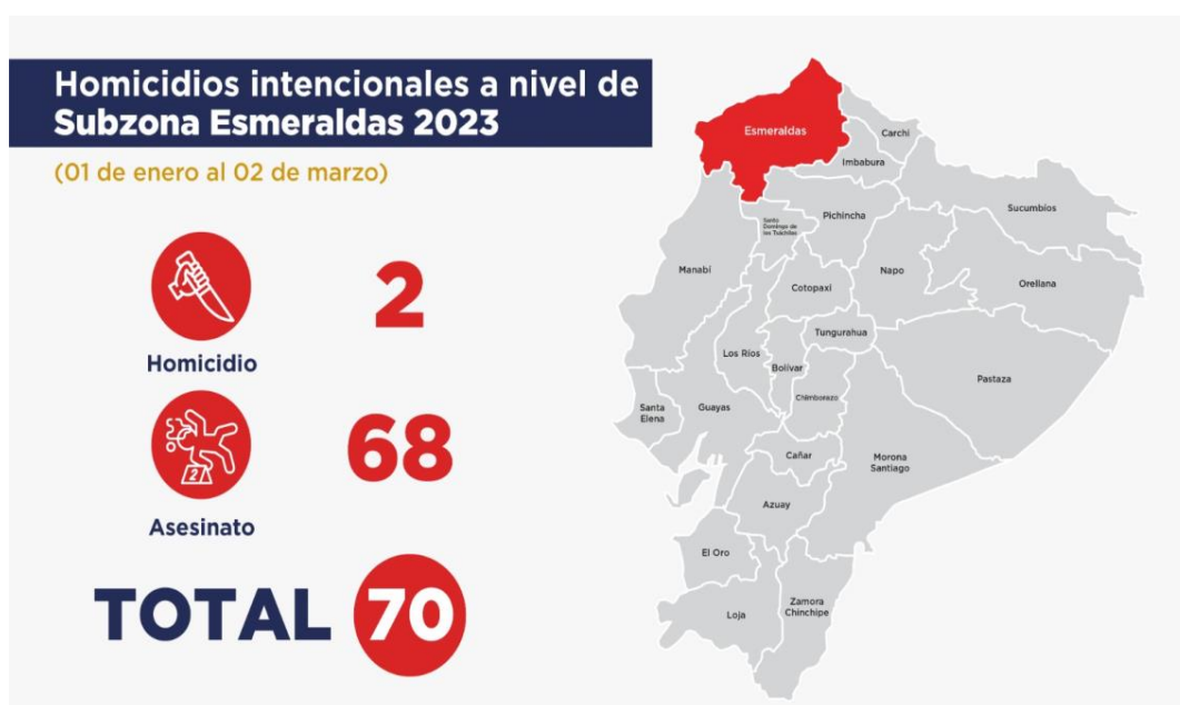
Imagen No.1: elaboración propia.

Que el Ministerio del Interior ha informado que se han suscitado al menos 68 asesinatos y 2 homicidios en lo que va del año 2023, sumando una totalidad de 70 homicidios intencionales; adicionalmente han existido 4 atentados contra Unidades de la Policía Comunitaria (UPC) en la provincia de Esmeraldas y varias amenazas a diferentes servidores policiales de la provincia de Esmeraldas;