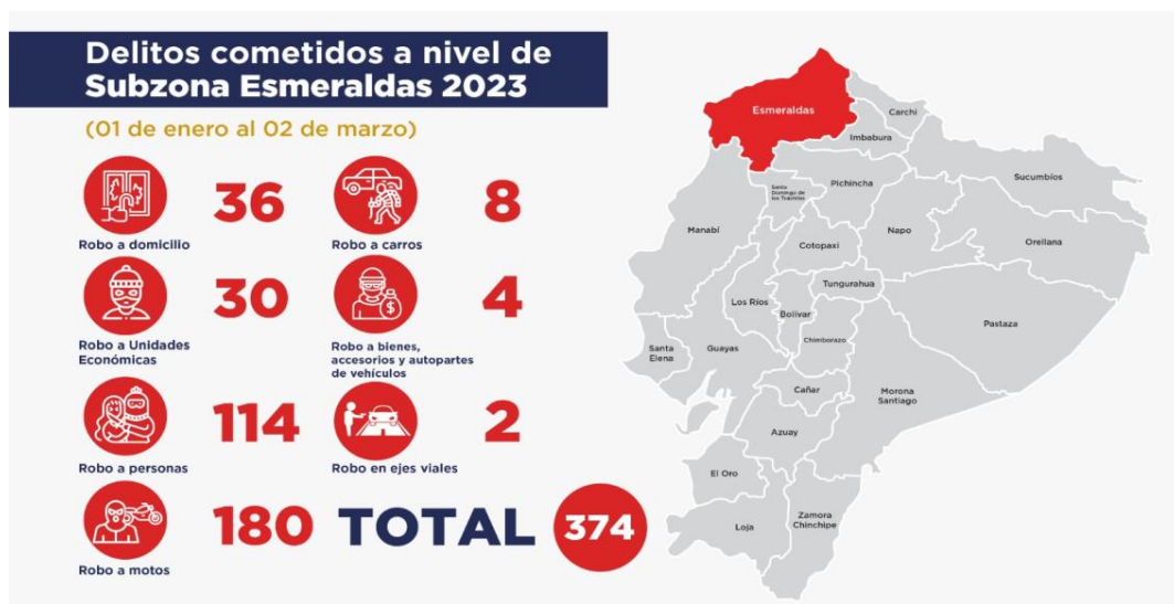
Imagen No.2: elaboración propia.