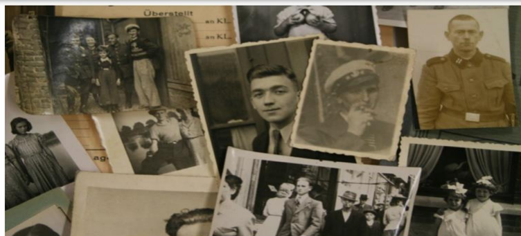
Bad Arolsen. Servicio Internacional de Búsquedas. Efectos personales de prisioneros a su arribo a los campos de concentración, que conserva el Servicio Internacional de Búsquedas.

Deber de buscar a personas desaparecidas (Agencia Central Búsquedas CICR)