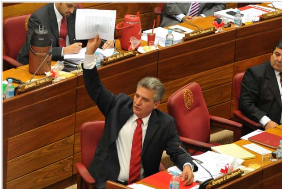
El senador Enrique Baccetta, presidente de la Comisión de Legislación, introdujo los cambios que finalmente fueron aprobados en el pleno del Senado.

La normativa establece, entre otras cosas, que todas las instituciones públicas deberán ofrecer información que obre en su posesión, custodia o control en la forma más amplia posible, excluyendo solo la que se encuentre alcanzada por una causal de excepción que sea legítima en el caso concreto y estrictamente necesaria en una sociedad democrática.