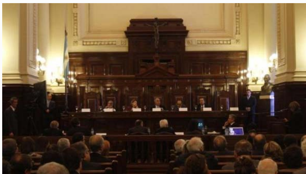
Corte Suprema de Justicia. | El máximo tribunal ratificó derecho al acceso a la información.

La Corte Suprema de Justicia de la Nación resolvió a favor del acceso a la información pública en un caso llevado adelante por la Asociación por los Derechos Civiles (ADC) como patrocinante del Centro de Implementación de Políticas Públicas para la Equidad y el Crecimiento (CIPPEC).