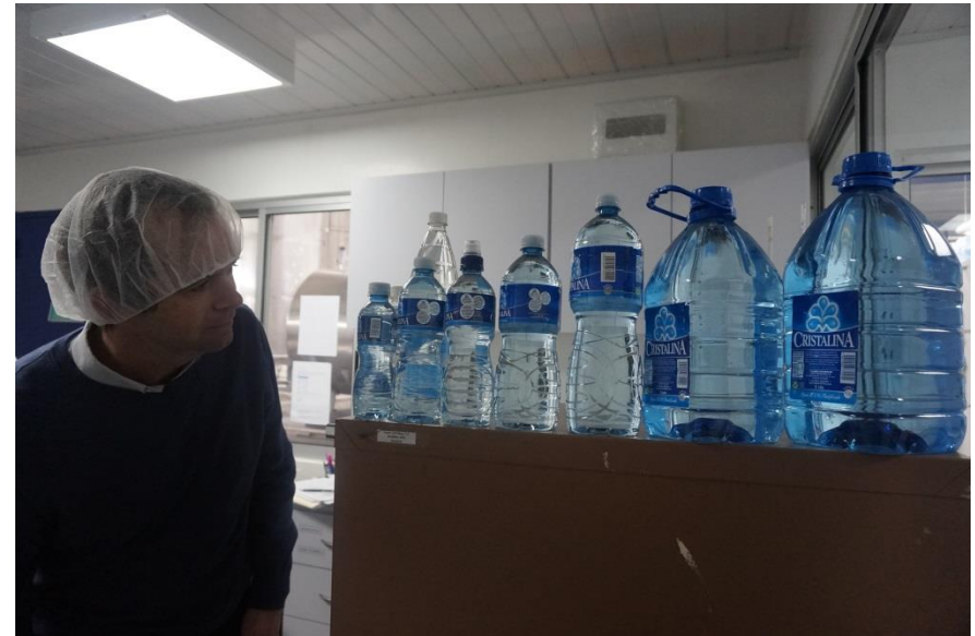
Empresa Panameña inicia el proceso de certificación C2C para sus botellas