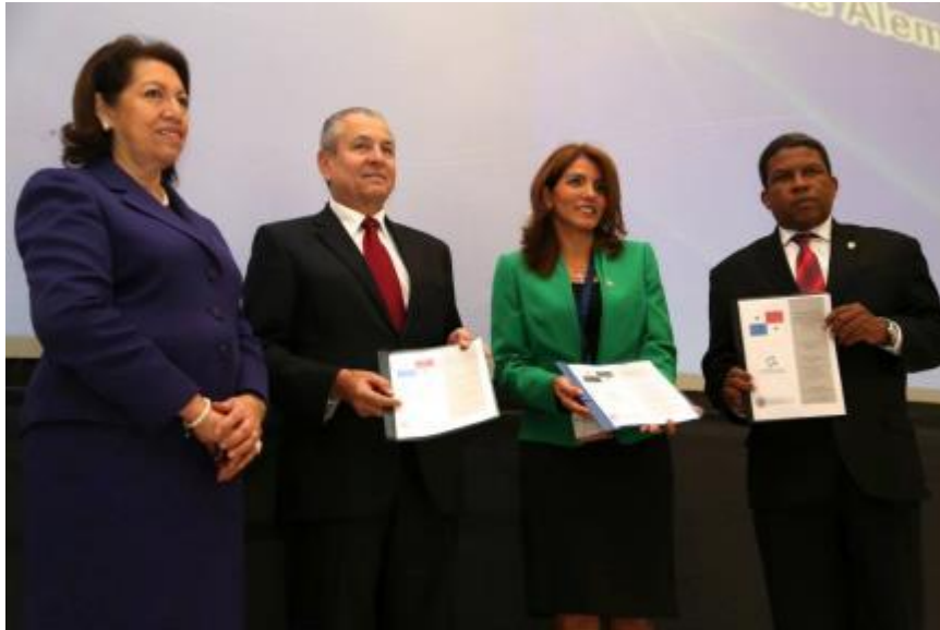
Representante de la OEA, el ministro del MICI, el presidente de SIP, y director de la ANAM reciben el borrador del Diagnóstico Productivo

Es una iniciativa lanzada por el Sindicato de Industriales de Panamá (SIP), el Ministerio de Industria y Comercio (MICI), y la Autoridad Nacional del Ambiente (ANAM) durante el octavo Simposio Internacional de Producción Más Limpia en 2013. El sello reconocerá a las empresas panameñas que cumplan con los criterios del sello. El objetivo es introducir metodologías de PCC incluyendo los principios de Cradle to Cradle como elementos clave en el proceso de desarrollo del Sello Panamá Verde.