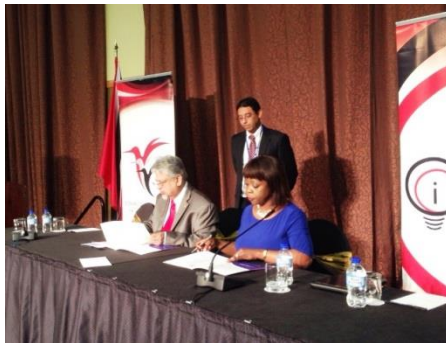
Ceremonia de firma de acuerdo para investigar el potencial desarrollo de embalaje sostenible en Trinidad y Tobago

Ministerio de Planeación y Desarrollo Sostenible