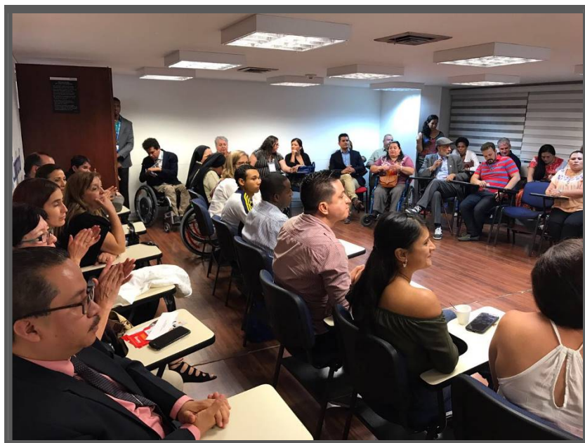
Descripción de imagen: miembros del CEDDIS durante las presentaciones de experiencias exitosas de emprendimiento e inclusión laboral. Sede de COMFANDI, miércoles 26 de abril de 2017.