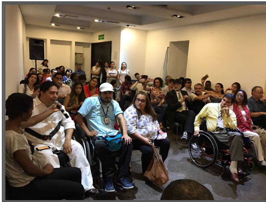
Descripción de imagen: Representantes de organizaciones de la sociedad en sala durante el diálogo con el CEDDIS (45 personas aproximadas). Al extremo izquierdo, uno de los representantes de la sociedad civil haciendo uso de la palabra. Hotel Spiwak, martes 25 de abril de 2017.