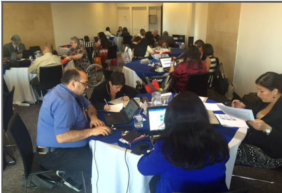
Descripción de imagen: Grupos evaluadores 1, 2, 4, 5, 6 y 7 en mesas de trabajo. Hotel Spiwak, miércoles 26 de abril de 2017.