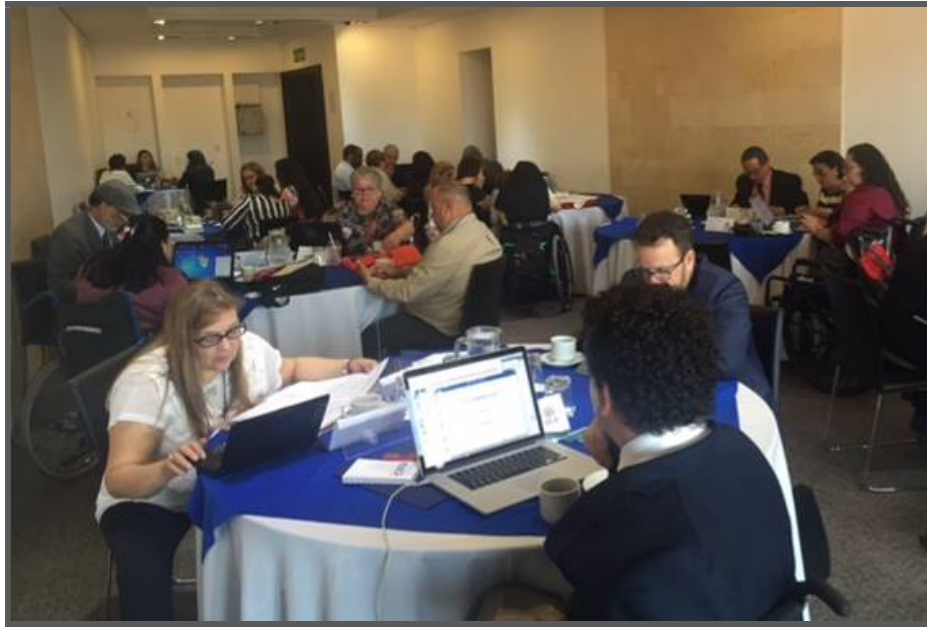
Descripción de imagen: Grupos evaluadores 1, 2, 3,5, 6 y 7 en mesas de trabajo. Hotel Spiwak, miércoles 26 de abril de 2017.

A continuación se presentan algunas imágenes ilustrativas de las jornadas de trabajo: