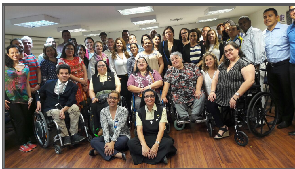
Descripción de imagen: miembros del CEDDIS, representantes del SPE y miembros de COMFANDI en foto grupal al término de la visita. Sede de COMFANDI, miércoles 26 de abril de 2017.