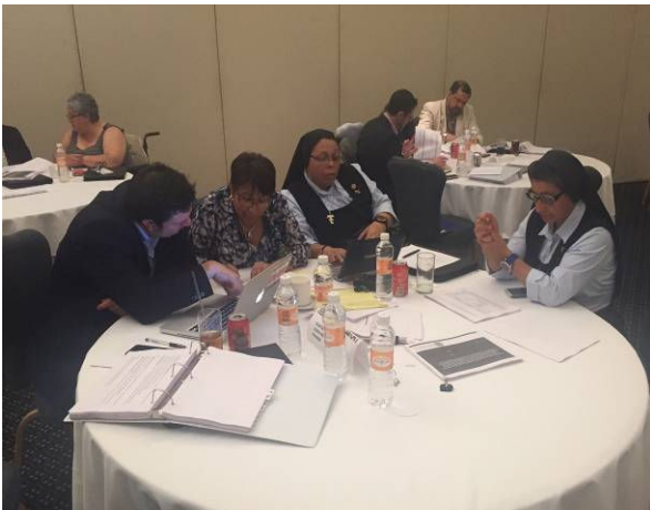
Grupo 5 Expertos de Costa Rica, Guatemala y Panamá en la mesa de trabajo