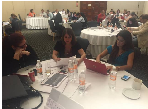
Grupo 6 Expertas de Paraguay, Argentina y México en la mesa de trabajo