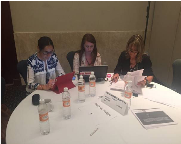
Grupo 9 Expertas de Chile, Costa Rica y Argentina en la mesa de trabajo