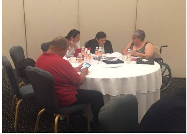
Grupo 8 Expertas de Guatemala, Panamá y Costa Rica en la mesa de trabajo