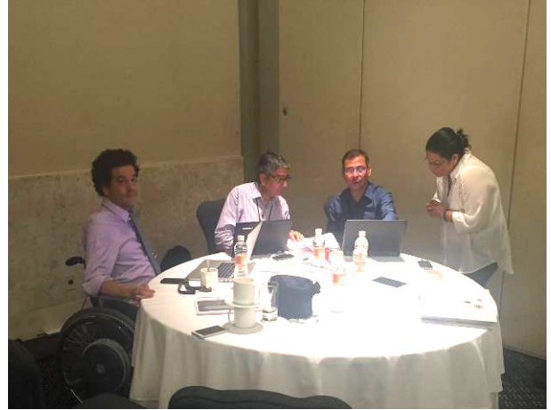
Grupo 4 Expertos de Colombia, Ecuador y Guatemala en la mesa de trabajo