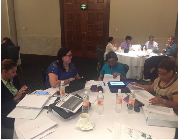
Grupo 3 Expertas de Costa Rica, Panamá y México en la mesa de trabajo