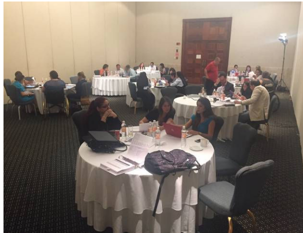
Imagen de todas las mesas de trabajo