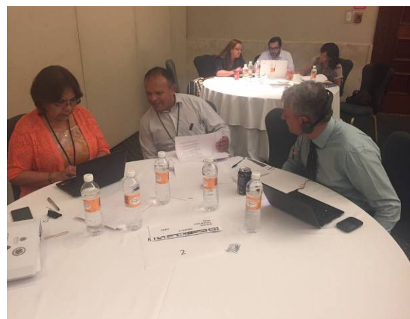
Grupo 2 Expertos de Perú, Bolivia y Argentina en la mesa de trabajo