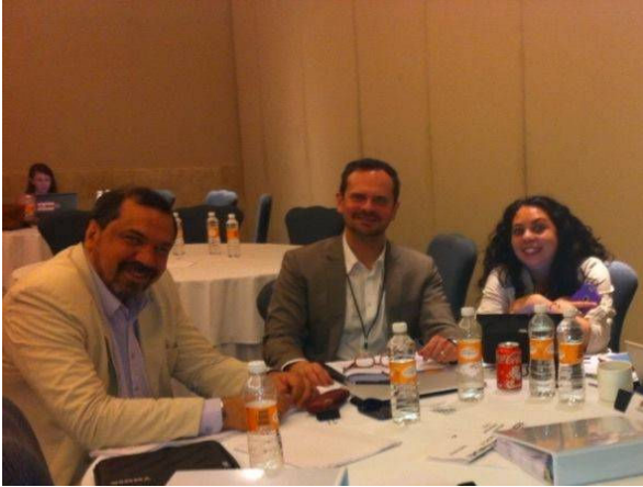
Grupo 7 Expertos de Paraguay, Chile y México en la mesa de trabajo