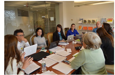
Comunicado de Prensa fin de sesiones

El GT celebró su Primer Período de Sesiones entre el 24 y 26 de febrero de 2015, en la sede de la OEA. Este evento marca la puesta en marcha del mecanismo de revisión previsto en el PSS respecto al análisis de los informes nacionales. Durante las sesiones los expertos evaluaron los primeros informes sometidos por los Estados Parte y definieron estrategias para incrementar la implementación de los DESC en las Américas.