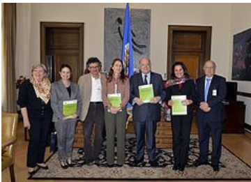
Artículo del boletín SEDI

El PSS es el Protocolo Adicional a la Convención Americana sobre derechos económicos, sociales y culturales (DESC). A la fecha, el PSS ha sido firmado por 19 Estados y ratificado por 16: Argentina, Bolivia, Brasil, Colombia, Costa Rica, Ecuador, El Salvador, Guatemala, Honduras, México, Nicaragua, Panamá, Paraguay, Perú, Suriname, y Uruguay.