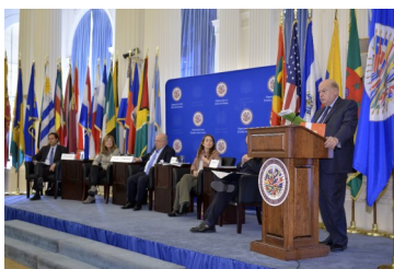
Nota de Prensa Mesa Redonda