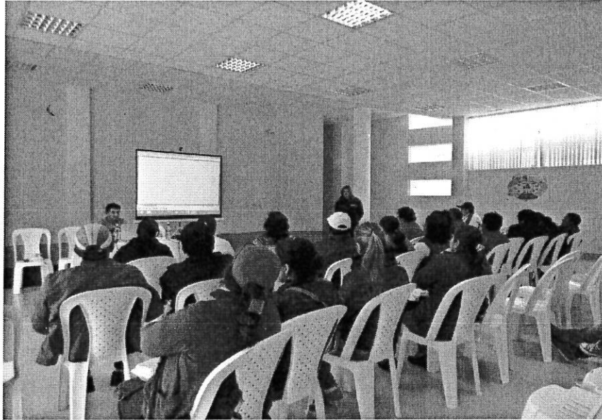
CENTRO DE INTERPRETACION DE LA HOJA DE COCA, CAFÉ DE ALTURA Y CULTURA AFROBOLIVIANA – Municipio de Coripata - Comunidad Nogalani.