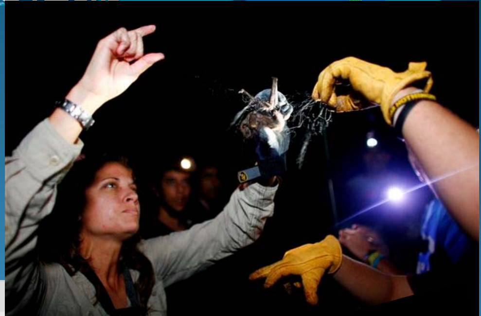
Participations by Project