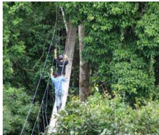
Sendero en el dosel.