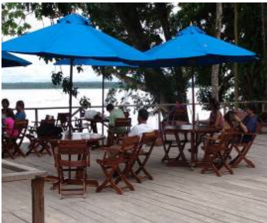
Parque Amacayacú: Centro de visitantes

Las iniciativas de integración no sólo son requeridas desde las instancias internacionales, sino también desde las locales. Como ejemplo, se han adelantado acuerdos de manejo bilaterales entre áreas protegidas, en el caso de la Zona Reservada Gueppi y el Parque Nacional Natural La Paya, entre Perú y Colombia; la ordenación del eje Tabatinga – Apaporis, entre Brasil y Colombia, o los acuerdos en el marco del Comité Presidencial para Asuntos Fronterizos –COPIAF- entre Venezuela y Colombia.