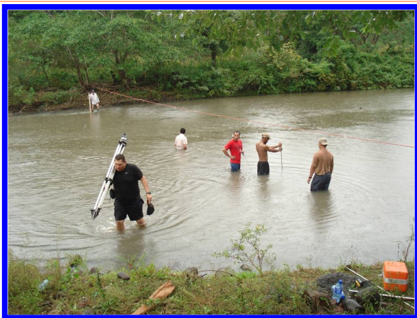
Figura 4. Práctica de campo durante el Taller Regional para Hidromensores, organizado por la OEA / DDS, en colaboración y con el apoyo de la OMM y el IDEAM de Colombia, noviembre de 2009, Río Viejo, Nicaragua.