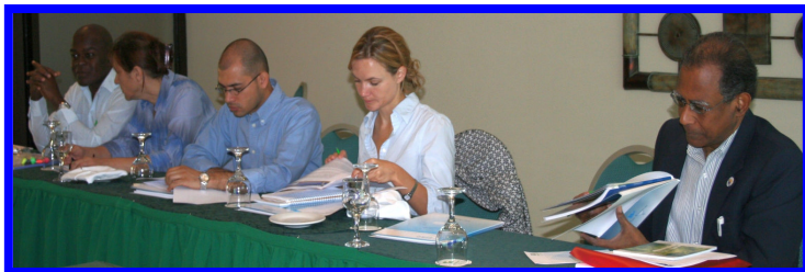
Figura 6. Plataforma Regional - Reunión preparatoria, febrero de 2009

las Américas, y la implementación de las Plataformas Nacionales (PN) bajo la Estrategia Internacional de las Naciones Unidas para la Reducción de Desastres (UNISDR) y el Marco de Acción de Hyogo (MAH). Asegurando la armonización y la racionalización de las estructuras y procesos, y el marco general de planificación de la Plataforma Regional para la Reducción del Riesgo de Desastres en las Américas, como parte del sistema de la UNISDR y el MAH, será considerado como elemental para el diseño e implementación de una Plataforma Regional de Sistemas Comunitarios de Alerta Temprana ante Inundaciones en el Istmo Centroamericano y la República Dominicana.