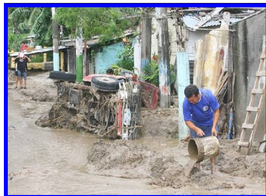
Figura 1. Después de la inundación, Tormenta asociada a la Tormenta Tropical Ida, 2009, Ilopango, El Salvador

Durante esa cooperación inicial, el SVP se llevó a cabo en más de 20 cuencas en Honduras, Guatemala y Nicaragua.