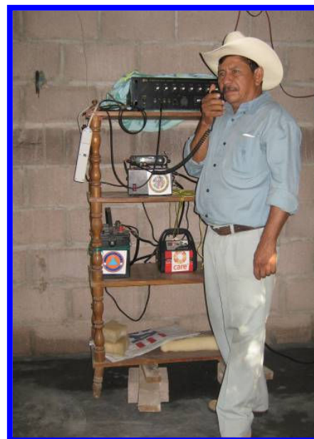
Figura 3. Voluntario de la comunidad en el sistema de alerta temprana con el apoyo de la SVP y desarrollado por CARE El Salvador. San Felipe, El Salvador

El enfoque centrado en la comunidad tiene una serie de beneficios. Entre las principales ventajas se encuentra el bajo costo y el bajo requerimiento de experiencia técnica. Por lo tanto, es más sostenible en el contexto de las comunidades locales vulnerables. Cuando las autoridades locales y la población participan en la implementación del sistema de alerta temprana ante inundaciones, se observa un mayor sentido de pertenencia y una mejor comprensión. Si, por ejemplo, los radios están instalados en una comunidad, como parte de un sistema de alerta temprana ante inundaciones más grande, pueden servir una variedad de propósitos adicionales, tales como emergencias de salud, convocatoria a importantes reuniones municipales o para transmitir otros mensajes importantes. De esta manera, los miembros de la comunidad incorporan el uso de radios en su vida cotidiana, garantizando la sostenibilidad de todo el sistema.