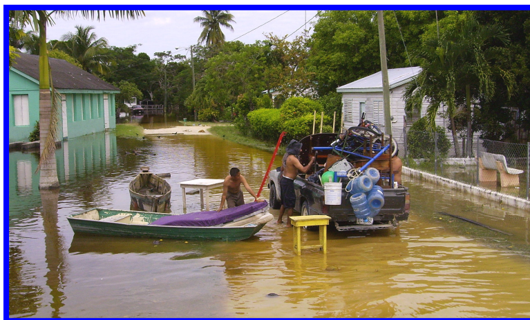
Figura 5. Evacuación de personas a causa de las inundaciones del río Hondo, causada por la depresión tropical # 16, Douglas Village, Belice, Noviembre 2008

Las comunidades no viven aisladas y por lo tanto la consideración de los demás municipios, así como la comunicación con ellos es esencial a fin de garantizar la sostenibilidad del sistema de alerta temprana ante inundaciones en toda la cuenca en su conjunto, y el bienestar de todos. Además, las comunidades aguas arriba pueden ayudar significativamente reduciendo los procesos de erosión que resultan de la deforestación, tala y quema agrícola. Si bien los SATs ante inundaciones siempre serán necesarios, reducir el impacto negativo de estas prácticas no sostenibles se traducirá en un aumento en los tiempos de concentración y tiempos de inundación, y en una disminución de las inundaciones en zonas bajas, aguas abajo.