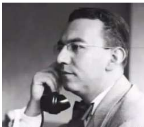
Dr. Gabriel Betancur Mejía (27 de abril de 1918 – 23 de marzo de 2002)

Dr. Betancur tenía un gran sentido del humor. Cuando supo que yo era Antioqueña y egresada de la Universidad de Antioquía se animó a contarme historias de su niñez agregando que nosotros los antioqueños somos muy emprendedores. Aunque nació en Bogotá, el Dr. Betancur provenía de familia antioqueña. Su padre murió en 1932, cuando él tenía apenas 14 años y fue enviado a Medellín a vivir con sus tíos. Dr. Betancur culminó sus estudios de secundaria y luego estudió Filosofía y Letras en la Universidad de Antioquia. Su sueño era estudiar en el exterior, lo cual era –y en menor medida continúa siendo- un privilegio de muy pocos.